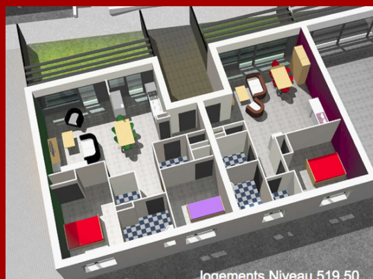
logements Niveau 519.50